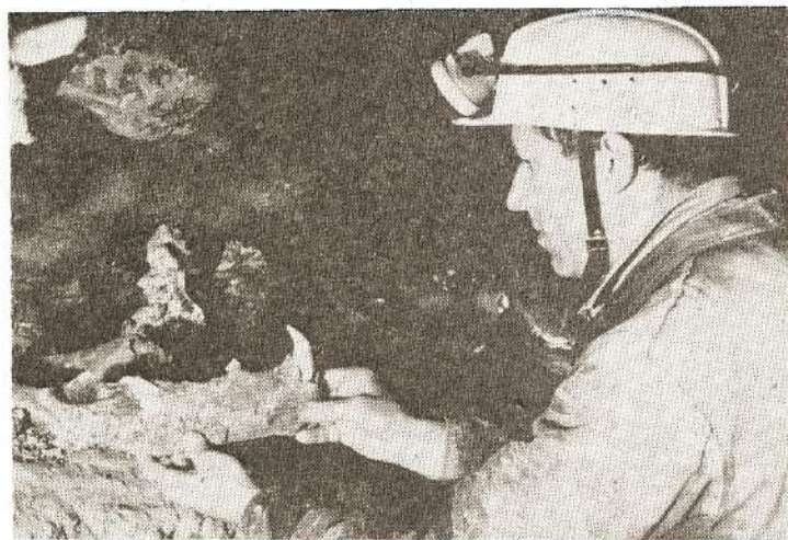
Радови на ископавању у пећини Рисовача изводе се ужурбане. Међу стручњацима су и рудари Рудника ватросталних глина.

руженог рада депоноваће у менице — у складу са законом о обезбеђењу средстава за инвестиције. Своју сагласност да се на такав начин обезбеди гаранција дао је и Управни одбор фонда за изградњу акумулационог система Гараша, из којег ће се Аранбеловац и његова привреда снабдевати водом, чиме ће тај проблем бити дугорочно решен.